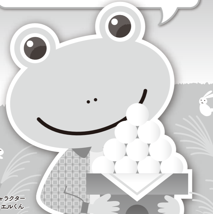
日本原燃広報キャラクター ツカッテモ・ツカエルくん